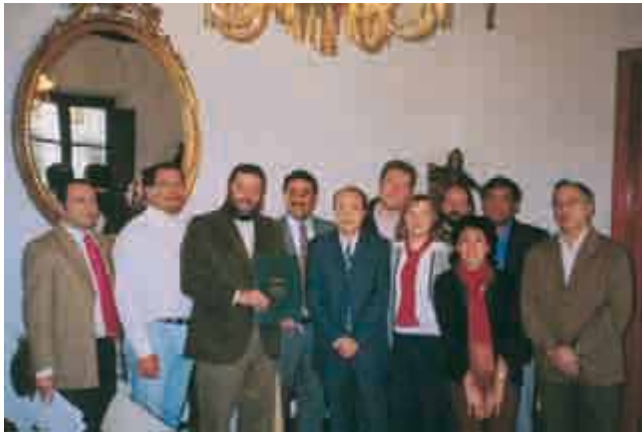
Jornadas de Cooperación al desarrollo de la Provincia de Córdoba

Intercambio de ideas con las mancomunidades de países del sur y perspectivas de futuro.