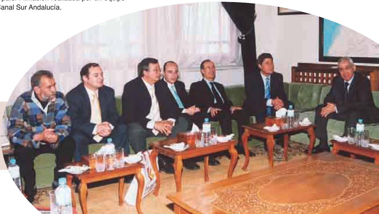
Visita a Marruecos 21 al 26 marzo 2004

Objetivos: Seguimiento a los proyectos de Chefchaouen y participación en el lanzamiento del programa Gold de Naciones Unidas en Oujda.