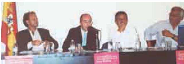
Jornadas sobre cooperación Área Andina 2005

Objetivos: Reflexión y puesta en común del trabajo realizado en el área andina por las organizaciones e instituciones andaluzas.