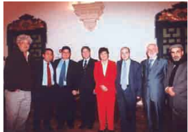
Seminario sobre Seguridad Alimentaria 2006

Objetivos: Reflexionar sobre la situación de inseguridad alimentaria que afecta al mundo y perspectivas de futura vistas desde el punto de vista de autoridades de algunos de los países afectados y de las organizaciones e instituciones que trabajan en este sentido.