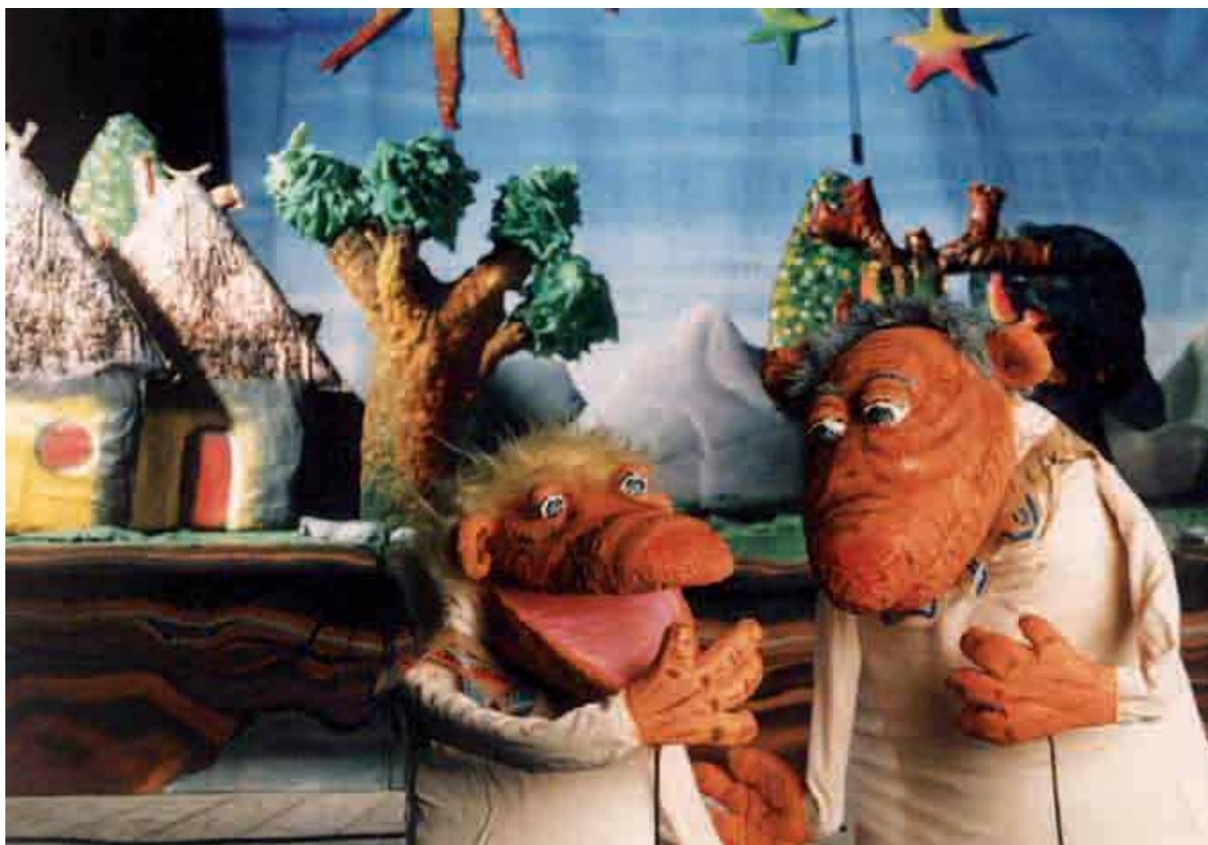
El teatro de títeres como herramienta de la educación para el desarrollo de la población infantil. Proyecto: La leyenda de los Nats. Veterinarios Sin Fronteras