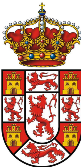
Imagen del escudo de la provincia de Córdoba